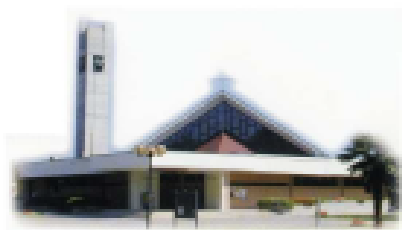
PARROCCHIA S. MARIA ASSUNTA RUBANO