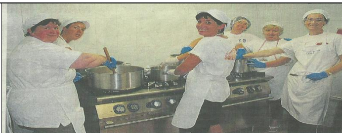
RUBANO La sagra festeggia i 720 anni della parrocchia e i 35 di dedizione Una lunga storia da far fruttare ancora